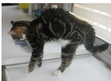
Chat peureux ou agressif

Dans tous les cas, plus l'animal est pris en charge rapidement, meilleurs seront les résultats . Mais un animal n'est jamais trop vieux pour être pris en charge !